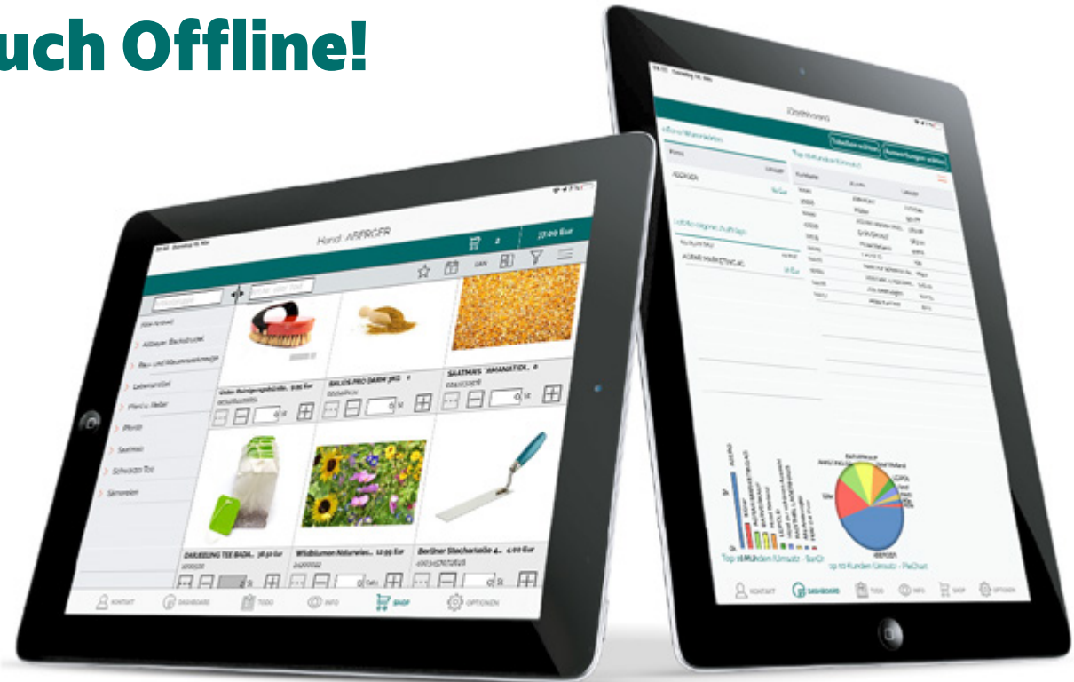
*Abbildungen können vom Standardlieferungsumfang abweichen